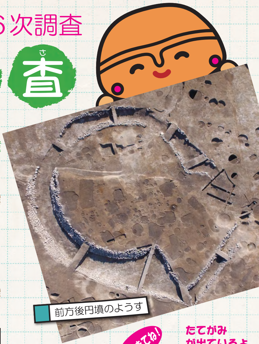
前方後円墳のようす