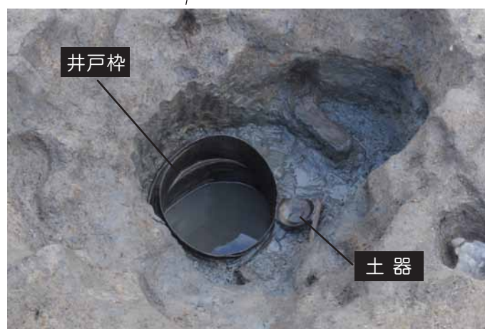
井戸を上から見た状況