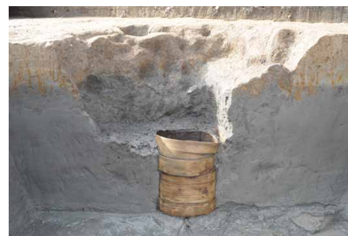
井戸を横から見た状況（直径 40 cm、高さ 50 cm）