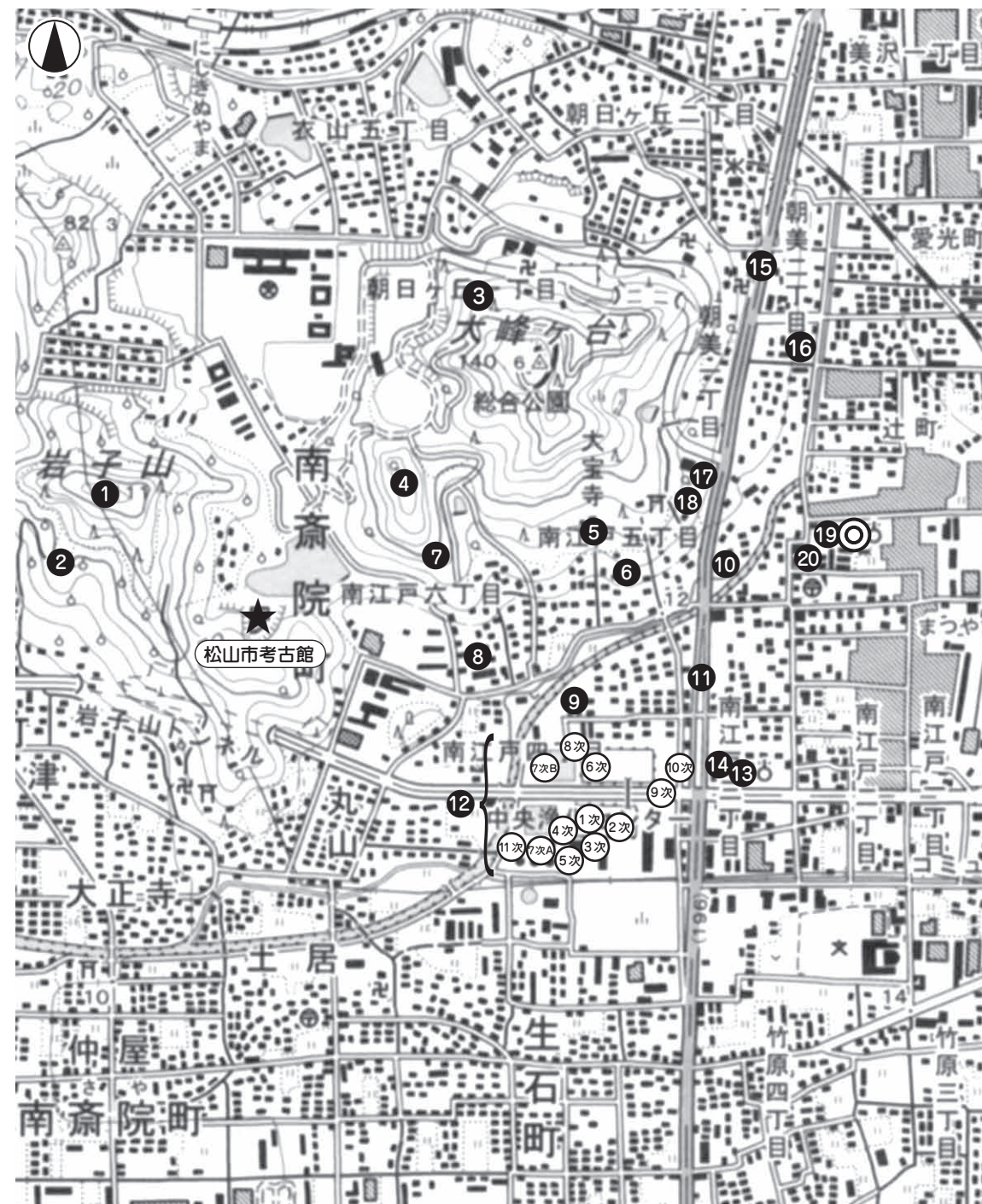
(S=1 : 12,500)

今後は、周辺に広がっている中世集落の様相や構造を詳細に解明することが重要課題といえるでしょう。