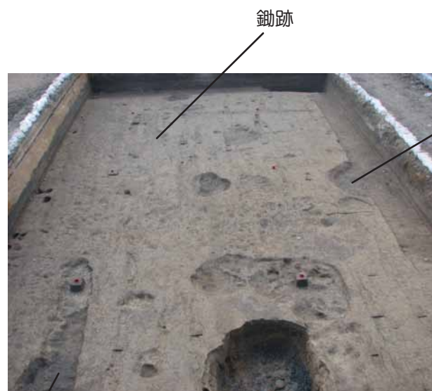
1区の中世遺構完掘状況（北より）