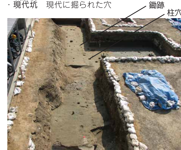
3区の中世遺構完掘状況（北より）