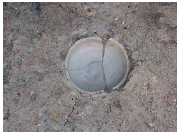
古墳時代の生活面から出土した須恵器

発掘調査は技術が進歩した現代でも主に人の手により行われます。掘るだけでなく、図面や写真に記録しながら調査しますので手間がかかります。