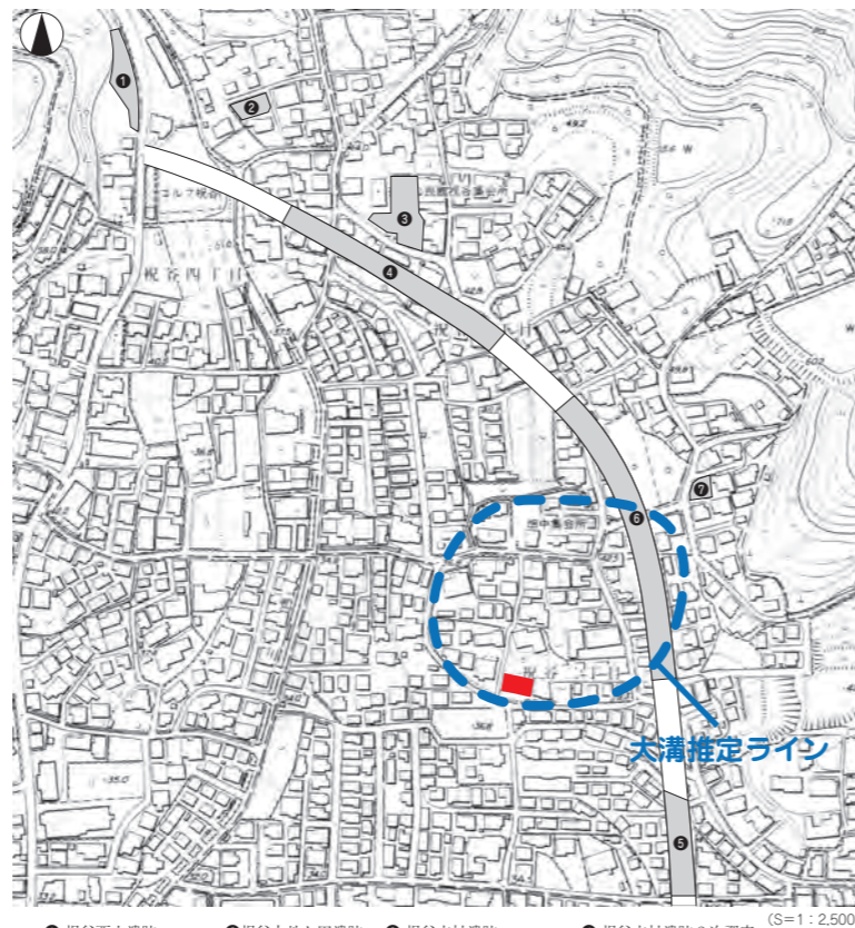
● 祝谷西山遺跡 ● 祝谷大地ヶ田遺跡 ● 祝谷本村遺跡 ● 祝谷本村遺跡 2次調査 ● 土居窪遺跡 2次調査 ● 祝谷畑中遺跡 ● 祝谷畑中遺跡 2次調査 ■ 祝谷畑中遺跡 3次調査 (S=1:2,500)

今回の調査では、弥生時代から中世の集落跡や生産跡が見つかり、当時の集落範囲や構造を解明する上で貴重な資料を得ることができました。