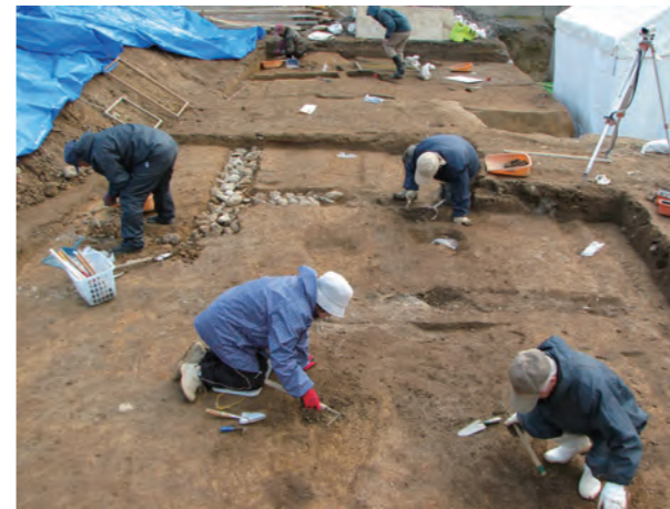
写真1 調査風景（西より）