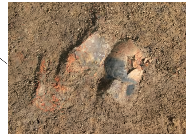
写真3 A区SB1の床面から出土した土器（南より）