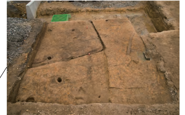
写真2 A区遺構完掘状況（北より）