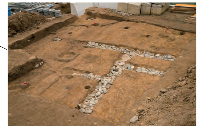
写真4 B区遺構完掘状況（北東より）