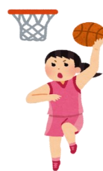
ミニバスケットボール