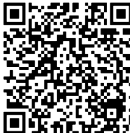
つばきネット二次元コード

※予約申込可能件数は、 5件/1ヵ月 です。(抽選当選分を含めます。既に利用した予約は含みません。)