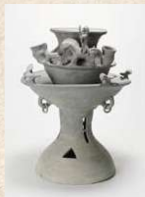
鳥取県野口1号墳出土の装飾付須恵器 (国指定重要文化財)倉吉博物館蔵

会場 松山市考古館 申込み 当日受付 料金 観覧料有料(予定) 一般200円、高齢者100円、団体(20人以上)160円、高校生以下無料